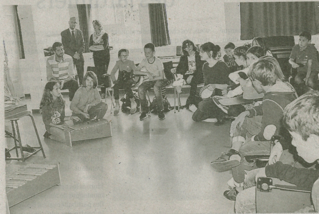
Cours de musique avec pratique instrumentale.